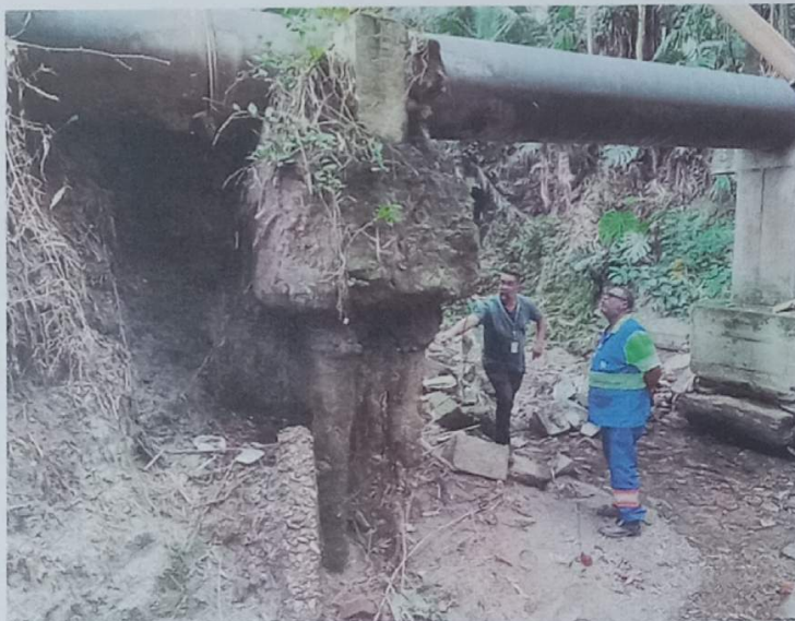
Foto 3 - Base de sustentação margem direita