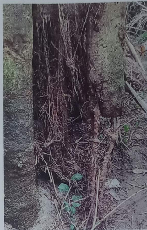
Foto 2 - Base sustentação margem direita