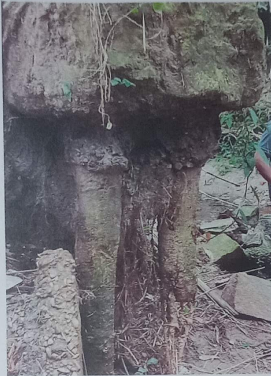
Foto 1- Base sustentação margem direita