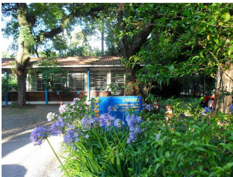
Entrada do prédio sede da UMAPAZ

A sede da UMAPAZ fica no Parque do Ibirapuera, com entrada pela Av. IV Centenário, 1268.