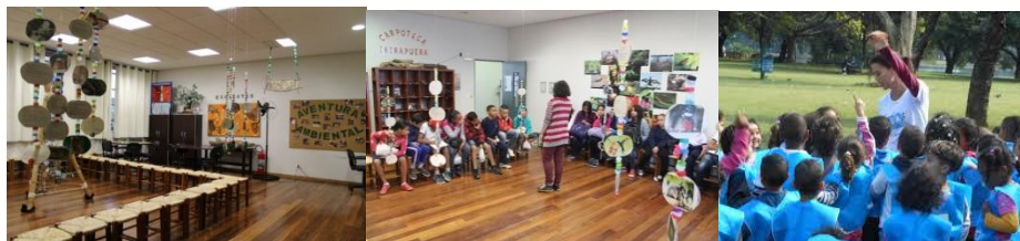
Biblioteca Espaço Sapucaia, UMAPAZ.

O mobiliário da sala Jacarandá é adequado para receber crianças. O espaço é utilizado para o programa Aventura Ambiental e outros encontros para público infantil.