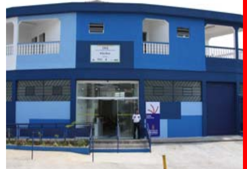
Centro de Especialidades Odontológicas CEO Cidade Tiradentes