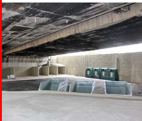
Ecoponto da Água Branca