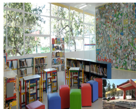
Piscinão Sharp – Campo Limpo