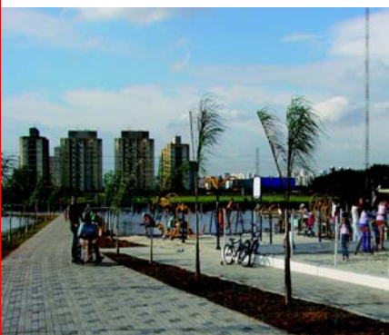
Parque Barragem de Guarapiranga