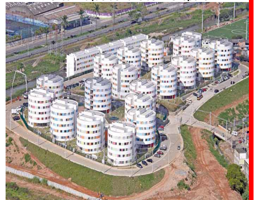
CEI Conjunto Habitacional Itaquera IV