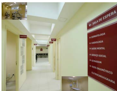
UBS Vera Cruz