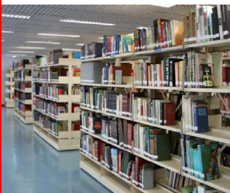
Biblioteca José Paulo Paes