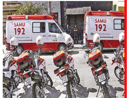
Urbanização de Favelas - Heliópolis