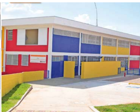
Centro de Educação Infantil - CEI Veredas