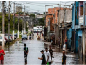
Imagem 1: Chuvvas afetam vida dos moradores da Vila Itaim, zona leste de São Paulo Edu Garcia/R7 https://noticias.r7.com/sao-paulo/buracos-e-carros-submersos-zona-leste-de-sp-sofre-com-enchentes-13022019 Imagem 2: ht https://spdiario.com.br/moradores-sofrem-com-infestacao-de-ratos-na-zona-sul-de-sp/ Imagem 3: https://www.prefeitura.sp.gov.br/cidade/secretarias/subprefeituras/jacana-tremembe/noticias/?p=90369

A doença acomete principalmente populações residentes em áreas de risco nas quais há fatores determinantes para manutenção desta realidade: ocupação de fundos de vale, proximidade a córregos, precariedade de saneamento básico e no padrão de habitabilidade, deficiências na coleta e destinação de resíduos sólidos, associados a fatores climáticos, como a ocorrência de inundações.