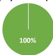
Proporção das Despesas