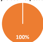
Proporção das Despesas