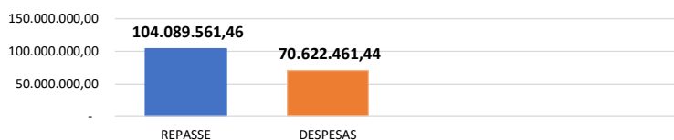
Relação Repasses X Despesas