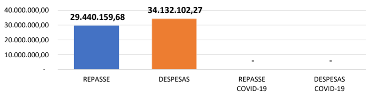
Relação Repasses X Despesas