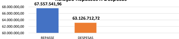
Relação Repasses X Despesas