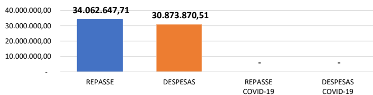
Relação Repasses X Despesas