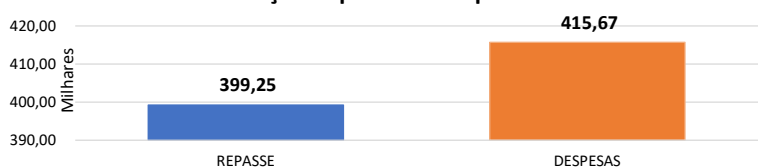
Relação Repasses X Despesas