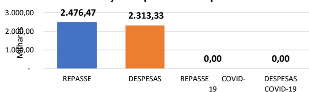
Relação Repasses X Despesas

A referida Prestação de Contas Financeira foi apresentada em documentação física e digital pela instituição, sendo analisada com base na Previsão Orçamentária do Plano de Trabalho, na Legislação vigente e segundo o Manual de Acompanhamento Financeiro. O presente Relatório de Análise Mensal foi modelo inicial desenvolvido por este Departamento de Prestação de Contas, instituído a partir do Decreto de nº 58.548 de 3 de dezembro de 2018. Após elaboração deste, podem ter ocorrido alterações durante a execução do exercício, o qual serão analisados e devidamente apontados no Relatório Conclusivo Anual.