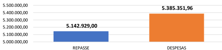
Relação Repasses X Despesas