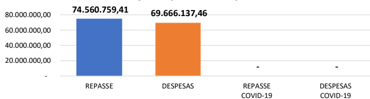
Relação Repasses X Despesas