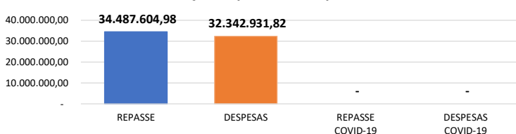
Relação Repasses X Despesas