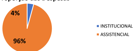
Proporção das Despesas