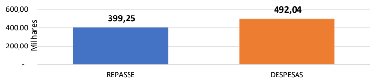
Relação Repasses X Despesas