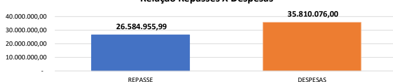
Relação Repasses X Despesas