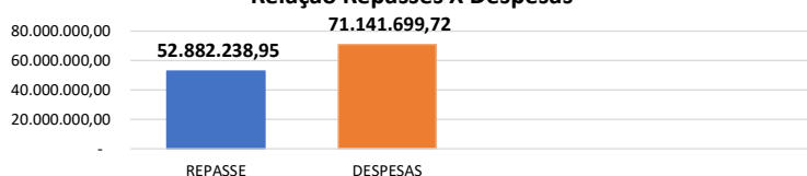
Relação Repasses X Despesas