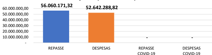
Relação Repasses X Despesas