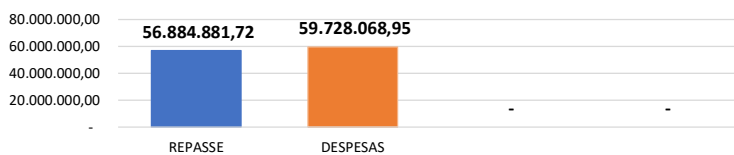
Relação Repasses X Despesas