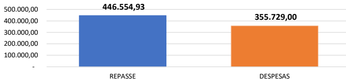
Relação Repasses X Despesas