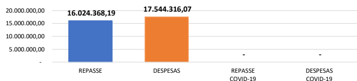
Relação Repasses X Despesas