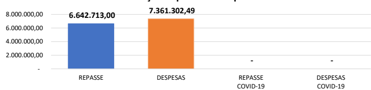
Relação Repasses X Despesas