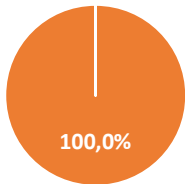
Proporção das Despesas