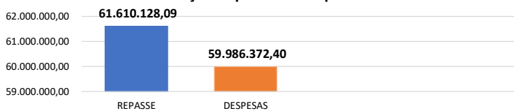
Relação Repasses X Despesas