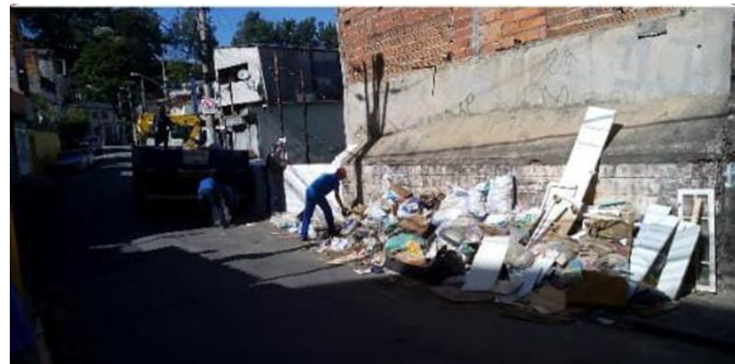
Rua Luis Oliveira Bulhões

Houve adoção de práticas sustentáveis, como redução do consumo de recursos naturais, separação correta de resíduos recicláveis, reutilização de materiais e organização de espaços domésticos. Registrou-se melhoria na percepção sobre impactos ambientais e no engajamento em ações coletivas, contribuindo para promoção da saúde, prevenção de agravos e fortalecimento da responsabilidade socioambiental no território.