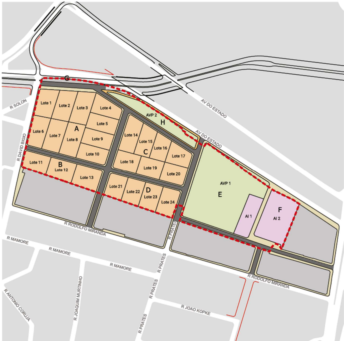
MAPA 1. PROJETO ESTRATÉGICO DETRAN

FIU Setor Central | Projetos Estratégicos Estudo de Parcelamento de Destinação