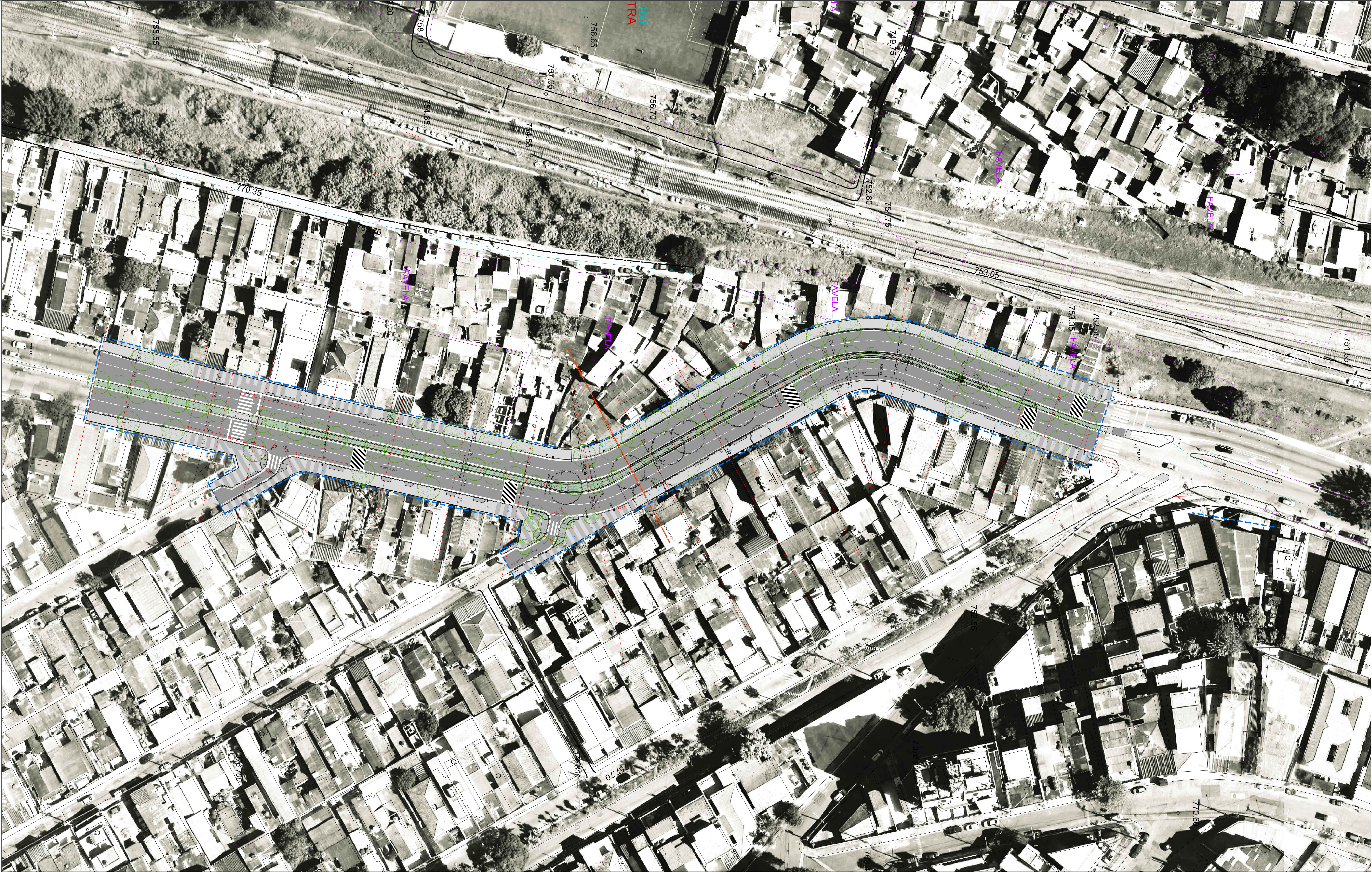
IMPLANTAÇÃO - URBANISMO ESCALA 1:500