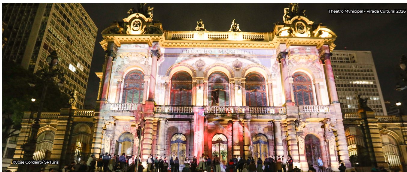
Theatro Mvncipal - Virada Cultural 2026

Nesta edição, o Boletim OTE apresenta a análise completa dos indicadores de desempenho do turismo paulistano em abril de 2026. Acesse observatoriodeturismo.com.br e acompanhe as séries históricas e outros estudos produzidos pelo Observatório de Turismo e Eventos (OTE) da SPTuris.